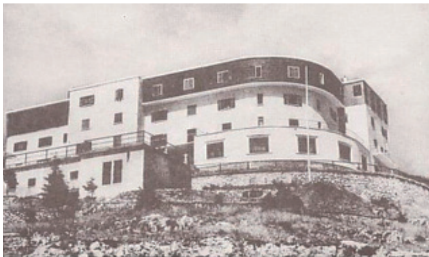
L'hotel Savoia-Belvedere dopo la costruzione (1936)

Gli ultimi 30 anni hanno visto il Monte Terminillo perdere in parte la vitalità dei primi decenni, tuttavia rimangono intatte le sue bellezze naturali con paesaggi incontaminati, le magnifiche foreste e le valli ricche di sentieri in grado di reggere il confronto con quelli dei massicci e dei parchi più visitati. A tutto questo si aggiunge un intorno pedemontano ricchissimo di storia, di cultura, di archeologia, di laghi, di terme, di architetture pregevoli e di prodotti artigianali. Il tutto a due passi.